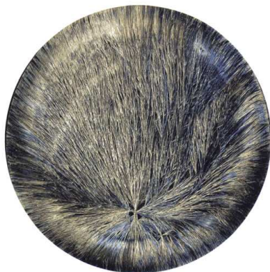
sensible Kristallisierung an Sojajogurt

Unsere ersten Forschungsergebnisse sind bereits sehr gut, sie zeigen allerdings nur die Richtung in die wir gehen müssen. Selbstverständlich bauen wir unsere Forschungskapazitäten ständig aus, indem wir unsere Ergebnisse durch neue Forscher und neue Anwendungsergebnisse verfeinern und ergänzen. Die Lichtpyramide kann aber bereits von jedem zur Verbesserung des eigenen Wohlergehens verwendet werden.